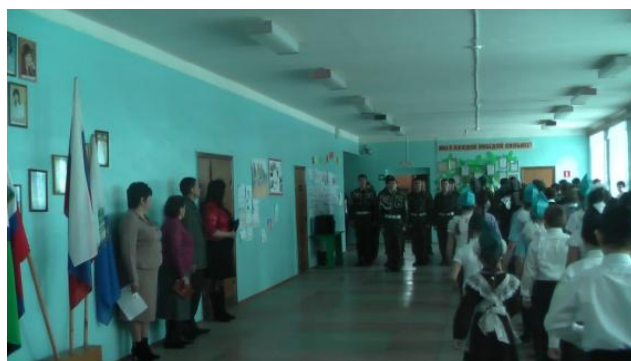
Смотр строя и песни в День Отечества для ветеран