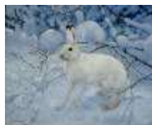
(Метка № 4)