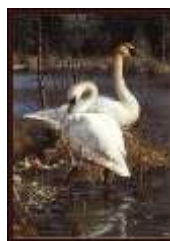
(метка № 3)