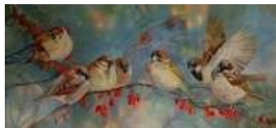
(Метка № 2)